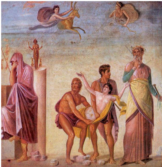
Жртвовање Ифигеније, зидна слика из Помпеја

Ужива у својој деци и својим ђацима, руским и јапанским писцима и шпанској музици.