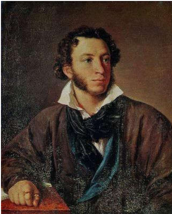
Василиј Тропинин – Пушкинов портрет