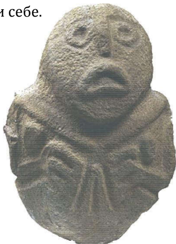
Скулптура из Лепенског Вира

Ушли смо у јун месец, ускоро ће лето, време за путовања. Загрлите своју земљу, ону у којој 21. јуна Сунце два пута излази изнад Лепенског Вира, у којој стоје најлепши камени мостови Европе, којом теку најчистије реке и певају ретке птице, земљу чији је народ створио најлепшу усмену књижевност на свету, земљу која је била царевина и која је опстала кроз веру и окупана мирисом тамјана изашла из најтежих искушења. Загрлите је и не дајте је, да не бисте изгубили себе.