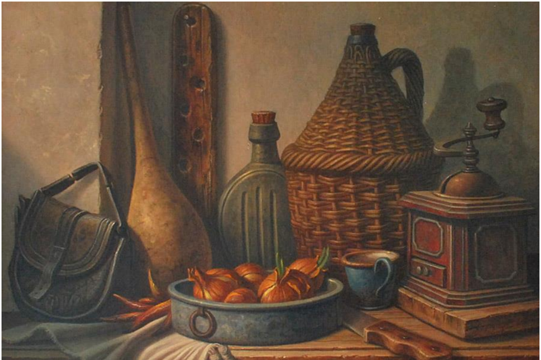
Драган Мартиновић - уље на платну