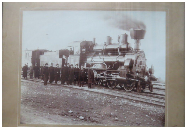
3/4 gekuppelte Schnellzug - Locomotive mit Brotan - Kessel Pola, 13. Januar 1905

Негде око поднева, на станици је било као у мравињаку. Сви Црнограсијани су били ту, и свима је у глави била само једна мисао: када ће воз стићи. Комешали су се и псовали једни друге, курве и певачице, просјаци и професори, песници и лудаци, глумци и пијанци, интелектуалци и слепци... некако по страни, стајали су друг Радиша Зацабић, грађанин Штедиша Одустих и господин Бандиша Рекетић.