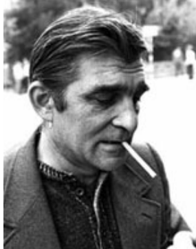
Мирослав Мика Антић

Двадесет осам година од смрти Мике Антића